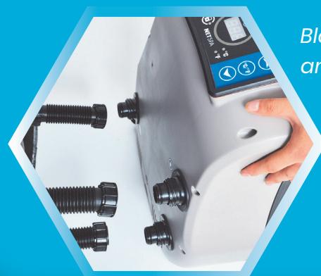
Bloc moteur amovible